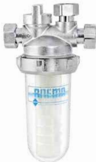
DOSAPOL-S-PLUS Ottone Satinato Tre Vie + Valvola Chiusura Con Cartuccia