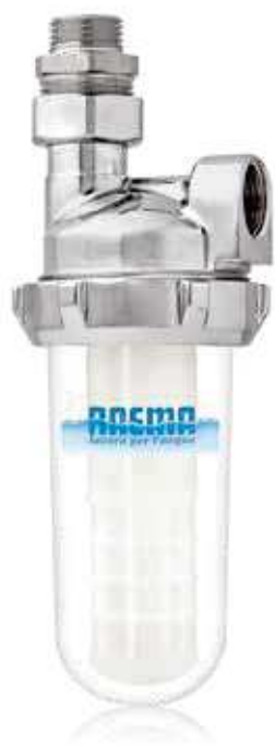
DOSAPOL-S Ottone Cromato Due Vie Con Cartuccia

Il dosatore Dosapol-S ha la duplice funzione di filtrare l'acqua da particelle in sospensione fino a 100 micron ed impedire la precipitazione del carbonato di calcio e magnesio che provoca le incrostazioni di calcare. Il silicato, contenuto nelle sfere, ha invece la funzione di creare, nel tempo, una pellicola protettiva delle parti metalliche a contatto con l'acqua e inibisce le corrosioni dovute ad acque aggressive. Trova una naturale collocazione su apparecchi riscaldanti quali lavatrici, lavastoviglie, boiler e caldaie. Quando le sfere, contenute all'interno della cartuccia sono consumate, si procede alla sostituzione della stessa con una semplice operazione che non richiede più di 5 minuti nè l'ausilio di personale qualificato. Questa apparecchiatura è sottoposta a manutenzione periodica per far sì che l'acqua, da essa erogata, mantenga le sue caratteristiche di potabilità. A norma del D.M. 25 del 07/02/2012 e D.M. 174/04.